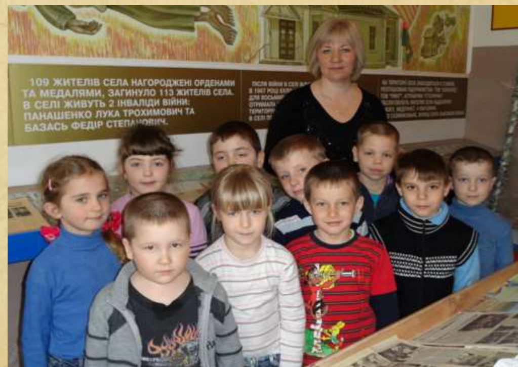
Краєзнавчий музей с.Здорівки