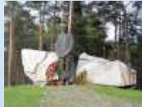
Рис. 1. Поховання у Басівці

Завдання: історіографічний аналіз теми; встановлення персоналій жителів села Здорівки потерпілих від репресій.