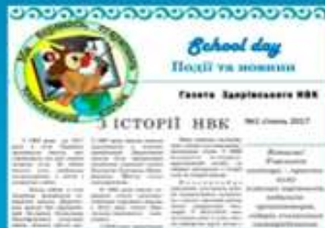
Газета «Шкільний день»