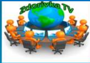
Шкільне телебачення «Студія ХХІ століття»